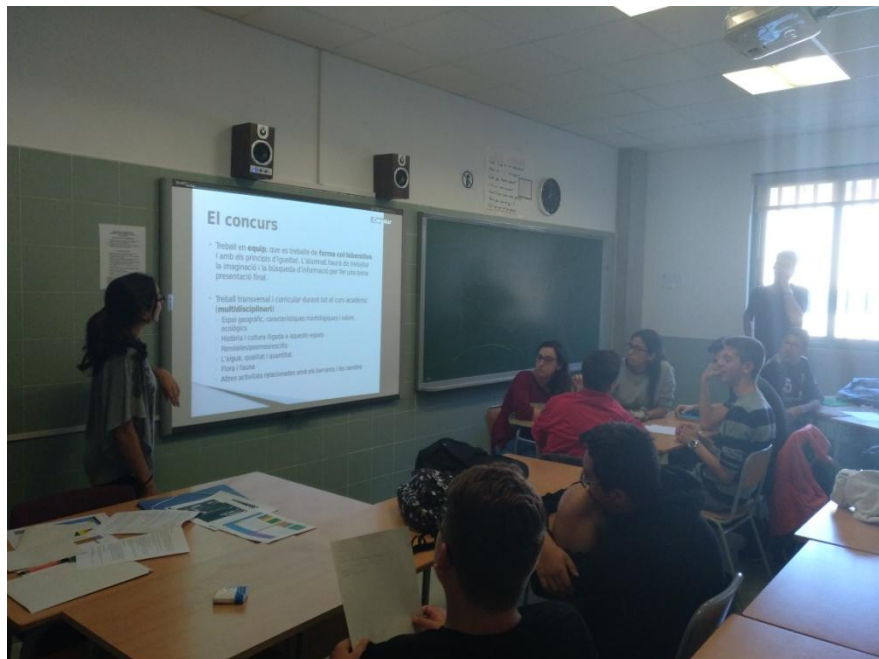
Taller de sensibilización: “¿Qué son los barrancos?”

real hacia el desarrollo sostenible”, dirigido a los y las estudiantes de 4º de ESO y que en esta edición la temática era “los barrancos de Vila-real”.