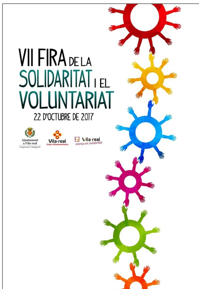
Feria Solidaridad y Voluntariado (Vila-real). Octubre 2017

Durante la jornada la ONG PANKARA realizó un taller de mandalas por la paz dirigido tanto a niños y niñas como al público en general.