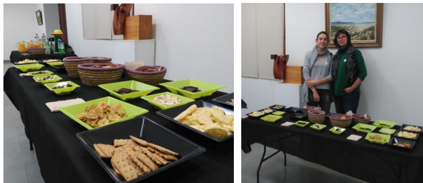
Degustación de productos de comercio justo

En el año 2017 la ONG PANKARA realizó varias pausas-café con degustación de productos de comercio justo, una de ellas para Caixa Rural de Vila-real en la II Jornada de cooperativismo y Emprendimiento social.