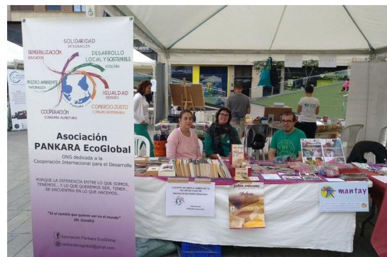
Feria Solidaridad y Voluntariado (Vila-real). Octubre 2017

También se realizó un taller de pompas gigantes de jabón para los más pequeños.