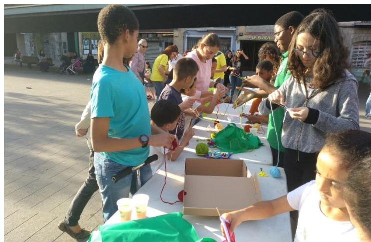
Taller de mandalas por la paz