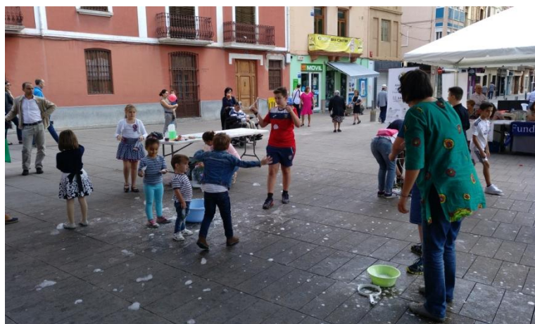
Taller de pompas gigantes de jabón