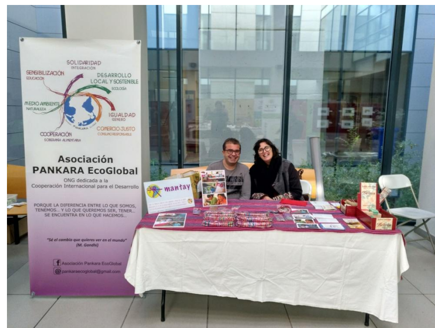
Semana Bienvenida Universidad Jaume I. Octubre 2017

Con esta campaña se recaudaron fondos para proyectos de Cooperación al Desarrollo, con un doble fin, por un lado obtener libros a cambio de la voluntad, y por otro recoger los libros donados, que sirvan para recaudar fondos en próximas acciones. Esta actividad ya iniciada en el 2012, se ha continuado durante los años 2013, 2014, 2015, 2016 y 2017, no sólo en la Universidad Jaume I, donde tuvo una gran acogida sino también en diferentes ferias y eventos. Además, se contó con la colaboración de Jabones Beltrán a través de la donación de jabones artesanales para poder recaudar fondos para los proyectos de cooperación al desarrollo llevados a cabo desde la entidad.