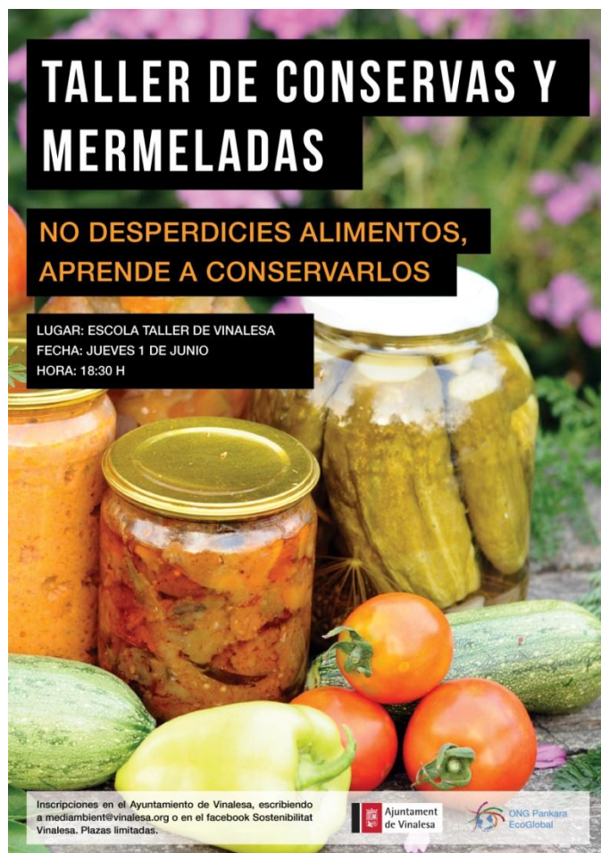
Cartel del "Taller de conservas y mermeladas". Junio 2017