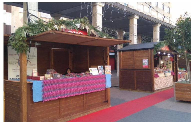
Mercado Navideño Castellón. Diciembre 2017