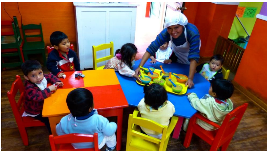
Casa Mantay. Cusco, Perú.

Proyecto “Mejora de la seguridad alimentaria y nutricional en la Casa de Acogida Mantay”. Proyecto subvencionado en el año 2017 en la convocatoria para la concesión de subvenciones por parte del ayuntamiento de Ibi. Este proyecto permitió cubrir parte de los gastos de alimentación de la Casa Mantay además de Aumentar el nivel de conocimientos en alimentación, nutrición y seguridad alimentaria de los beneficiarios del proyecto.