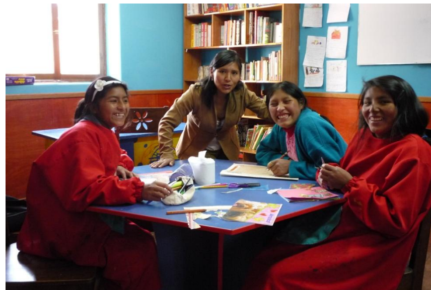
Casa Mantay. Cusco, Perú.

proyecto fue aprobado a finales del año 2017 y se está ejecutando en el año 2018.