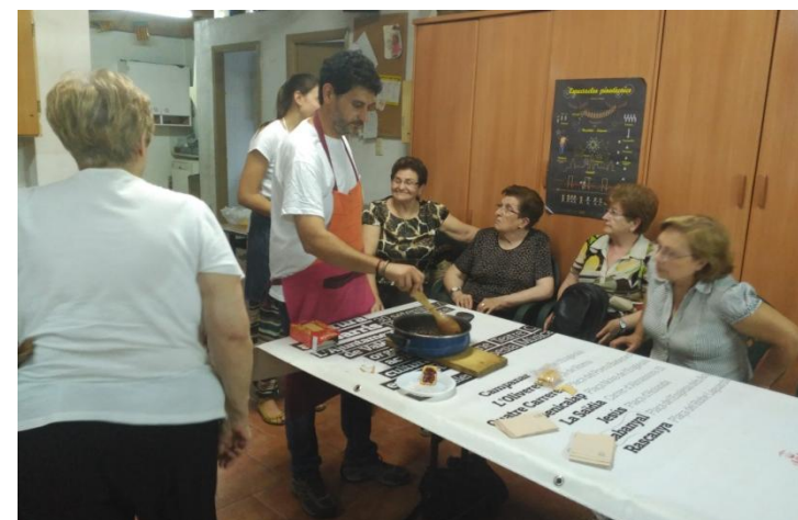
Taller de conservas y mermeladas. Junio 2017.