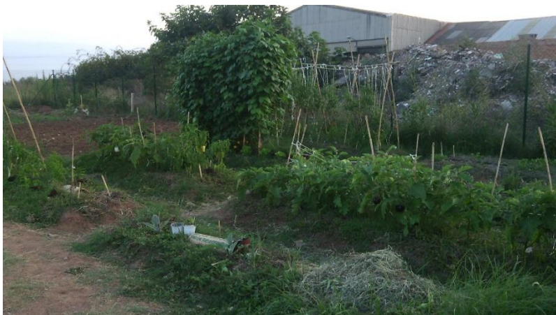
Parcela en los huertos urbanos de Vila-real