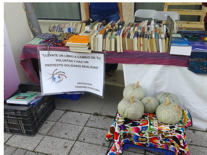
Semana Bienvenida Universidad Jaume I. Octubre 2015

voluntad, y por otro recoger los libros donados, que sirvan para recaudar fondos en próximas acciones. Esta actividad ya iniciada en el 2012, se ha continuado durante los años 2013, 2014 y 2015, no sólo en la Universidad Jaume I, donde tuvo una gran acogida sino también en diferentes ferias y eventos.