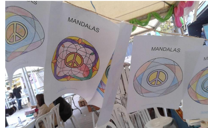
Mandalas para la PAZ. Feria Solidaridad y Voluntariado (Vila-real). Octubre 2015