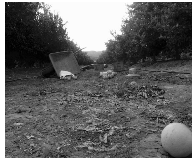
“¡A hacer puñetas!”. Premio a la fotografía más original