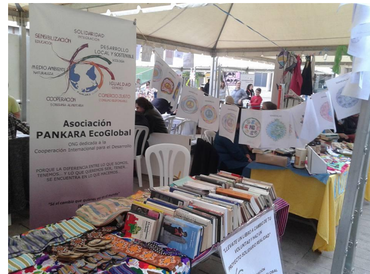
Feria Solidaridad y Voluntariado (Vila-real). Octubre 2015

Con la participación en la feria se recaudaron fondos para proyectos de Cooperación al Desarrollo y actividades llevadas a cabo desde la ONG, a través de la campaña "llévate un libro a cambio de tu voluntad y haz un proyecto solidario realidad", con un doble fin, por un lado obtener libros a cambio de la voluntad, así como recoger libros donados que sirvan para recaudar fondos en próximas acciones, y por otro sensibilizar al municipio de Vila-real en cooperación al Desarrollo, con el fin de reflexionar sobre la pobreza, la exclusión y las causas que la producen y perpetúan.