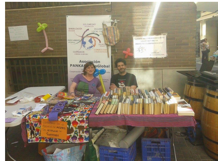
Fiesta Bavaria Solidaria (Vila-real). Mayo 2015

Con esta actividad, el 20% de los ingresos obtenidos en el consumo de cerveza Bavaria durante el día 16/05/2015 se donaron a la ONG PANKARA con el fin de apoyar proyectos de Cooperación al Desarrollo.