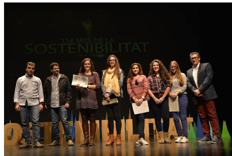
Gala de la Sostenibilidad

Los ganadores del concurso fueron, los alumnos de 4º de ESO del centro Fundación Flors, los cuales presentaron su proyecto y se les hizo entrega del correspondiente premio en la Gala de la Sostenibilidad celebrada en el Auditorio de Vila-real el jueves 29 de Noviembre de 2015.