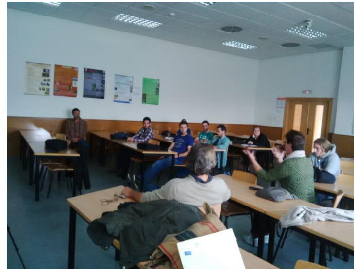
Seminario- taller “Nuevos modelos de la producción de alimentos. Agro-ecosistemas y conservación medioambiental” Universitat Jaume I” Octubre 2015