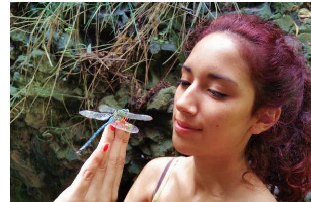
“Miembros de un todo lleno de vida”. Premio a la mejor fotografía