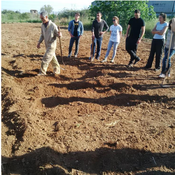
Talleres Prácticos en los huertos urbanos de Vila-real. Curso “Sostenibilidad y agricultura ecológica” Universitat Jaume I Abril 2015