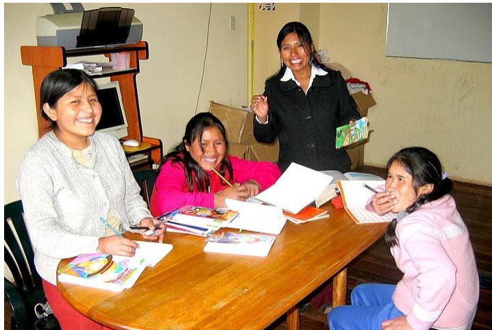
Taller Casa Mantay. Cusco, Perú.

MANTAY es una casa de acogida para madres adolescentes. Situada en el barrio de San Jerónimo, Cusco (Perú). Su objetivo es acoger y educar en la maternidad a niñas menores de edad que viven en situación de abandono y desamparo. En Perú se producen tres violaciones cada hora, el 66% de las cuales es a niñas menores de 14 años. Durante el tiempo que las adolescentes y sus hij@s permanecen en la casa, desde su llegada al hogar hasta que las mamás cumplen 18 años, se les ofrece una atención integral, cubriendo sus necesidades SANITARIAS, NUTRICIONALES, AFECTIVAS Y PSICOLÓGICAS, LEGALES Y EDUCATIVAS.