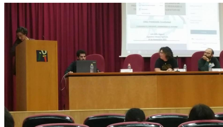
Presentación del proyecto en la Jornada "Humanizando la Economía" Universitat Jaume I" Noviembre 2015