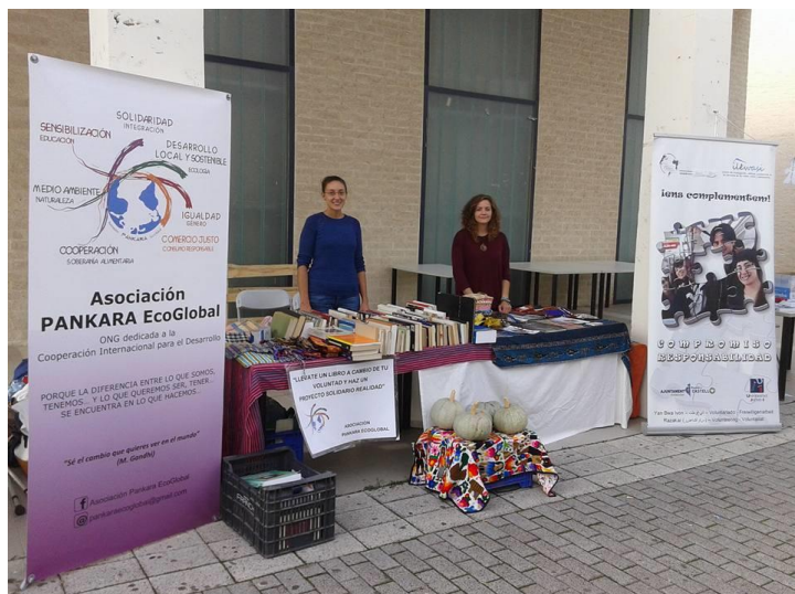
Semana Bienvenida Universidad Jaume I. Octubre 2015

Campaña "¡Llévate un libro a cambio de tu voluntad y haz un proyecto solidario realidad".