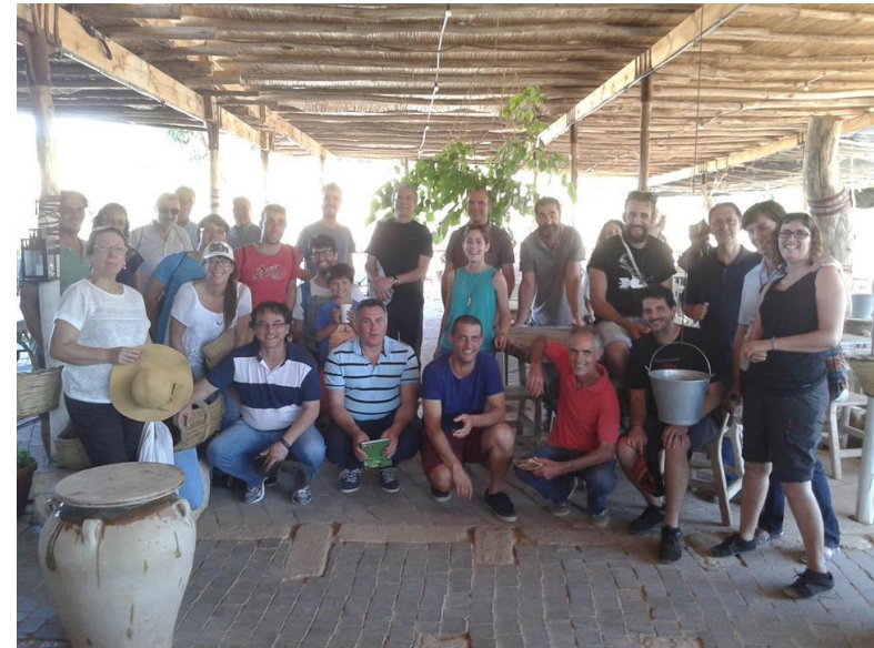
Excursión final de Curso “Sostenibilidad y agricultura ecológica” Universitat Jaume I Junio 2015