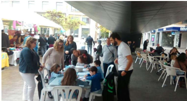
Mandalas para la PAZ. Feria Solidaridad y Voluntariado (Vila-real). Octubre 2015

Por otro lado se realizó la actividad “Mandalas solidarios” dirigida a los más pequeños, los cuales, junto a sus padres pintaron mandalas para la Paz. Estos mandalas simbolizaban la no violencia, y el lograr vivir en un mundo de paz. En el contexto actual de crisis humanitaria y conflictos que estamos viviendo a través de pintar mandalas se simbolizó el deseo de los niños/as en que haya paz y finalicen los conflictos. Posteriormente los se expusieron en un panel junto con mensajes para la paz que los visitantes a la feria fueron escribiendo a lo largo del día.