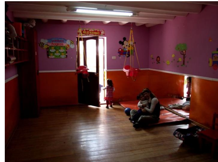
Guardería Casa Mantay. Cusco, Perú.